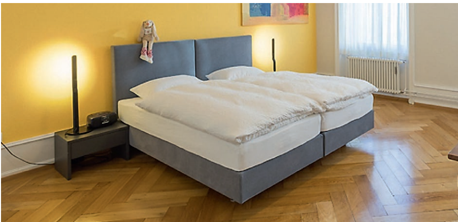
Das Zimmer Basilisk in neuem Gewand.

Ein traumhaftes Sponsoring hat den Erwerb neuer Betten ermöglicht.