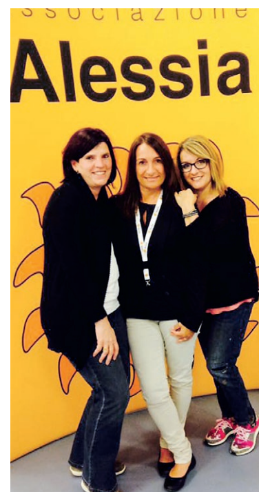
Il team Associazione Alessia.

Le Case Ronald McDonald non solo mettono a disposizione delle famiglie con bambini malati un soggiorno temporaneo nelle vicinanze degli ospedali pediatrici, ma collaborano attivamente con associazioni che operano in tutta la Svizzera per migliorare il più possibile le cure pediatriche, sia a livello medico, sia sul piano emozionale. Una di esse è l'Associazione Alessia, di Vernate, Canton Ticino, nata nel 2004 per sostenere le famiglie confrontate con malattie pediatriche in diversi ambiti, come ad esempio la raccolta di fondi per l'acquisto di macchinari o il sostegno economico a chi deve affrontare un ricovero lontano dal suo ambiente. Le Case Ronald McDonald sono liete di collaborare con associazioni come quella sorta a Vernate, per consentire alle famiglie di affrontare nelle migliori condizioni possibili il loro difficile momento.