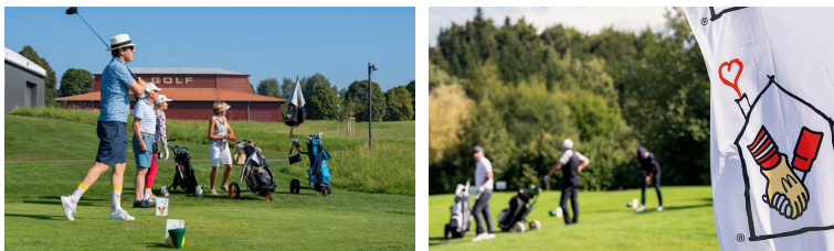
Impressionen vom McMasters 2023.