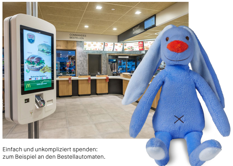
Einfach und unkompliziert spenden: zum Beispiel an den Bestellautomaten.

Zudem wird vom 24. bis am 26. November 2023 CHF 1 pro gekauftem Happy Meal an die Kinderstiftung gespendet. Das Spenden bei McDonald's ist allgemein einfach und unkompliziert: Seit drei Jahren können die McDonald's-Gäste neben den Kässeli an der Theke auch an jedem Bestellautomaten eine Spende für die Kinderstiftung tätigen. Der Reinerlös kommt der Ronald McDonald Kinderstiftung zugute – und hilft so betroffenen Familien in ihren schwierigen Situationen. Ein herzliches Dankeschön für all diese Spenden – ob gross oder klein, die Hilfe kommt an.