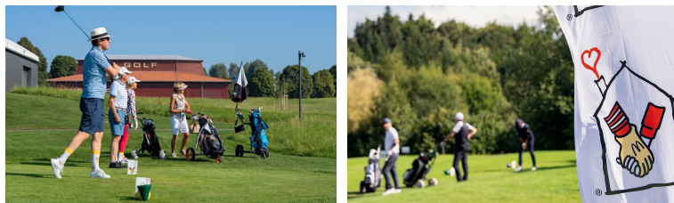
McMasters 2023: photos